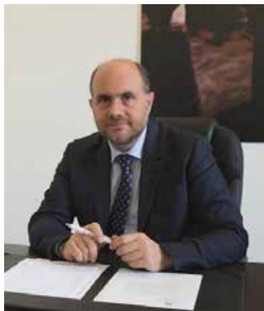
Il presidente Unpli Antonino La Spina

L' Infiorata delle Pro Loco d'Italia , nell'ambito di un'iniziativa collegata all' Infiorata Storica di Roma che la Pro Loco di Roma Capitale con grande intuizione ha saputo brillantemente riportare alla luce e valorizzare in occasione della festa del 29 giugno, per i Santi Patroni della città SS. Pietro e Paolo , valorizza una tradizione sentita e rievocata in molte regioni, legata in alcuni casi alla celebrazione del Corpus Domini.