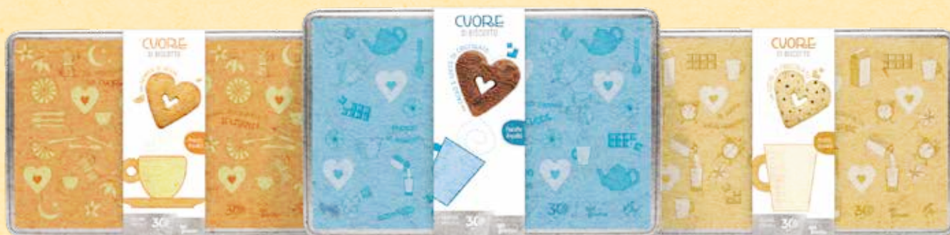
ARANCE DI SICILIA

A fine iniziativa, dovrai indicare il valore complessivo delle donazioni libere che avrai raccolto nell'apposita casella del Modulo di rendicontazione.